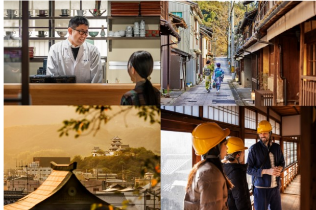
OZU STORIES イメージ画像