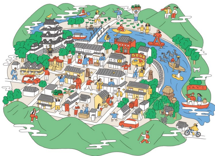
【「大洲カンパニー」キービジュアル】

「大洲カンパニー」では、オンラインコミュニティ専用サービスアプリ「FANTS（ファンツ）」を用いて、体験プログラムやイベントを掲載し、アプリ上で大洲市の方や登録者同士が交流し、実際に大洲市まで来訪してプログラムに参加することで、関係人口創出を図ります。また、専用サイトも立ち上げ、今後はそのサイト内で移住に役立つ空き家情報等を掲載していきます。